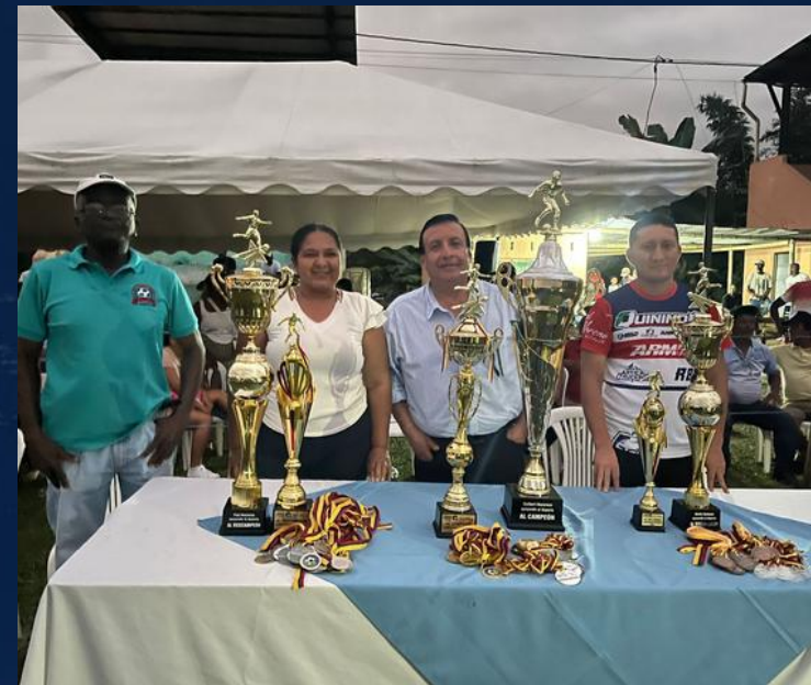
ASISTENCIA A EVENTOS DEPORTIVOS