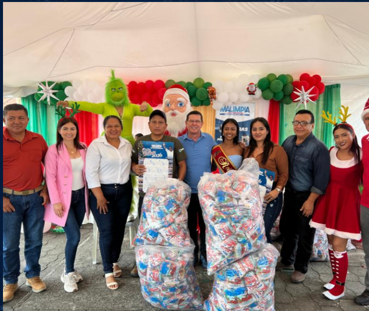
ENTREGA DE CONFITES NAVIDEÑOS