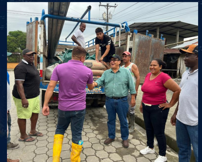
ENTREGA DE MATERIALES