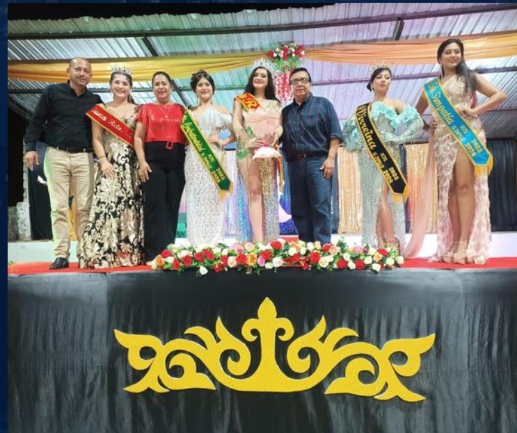
ASISTENCIA ELECCIONES DE REINAS