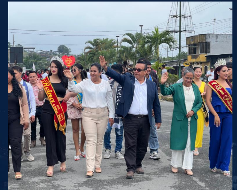
ASISTENCIA A EVENTOS CÍVICOS