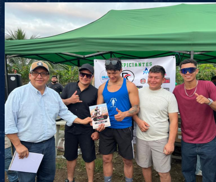
ASISTENCIA A EVENTOS DEPORTIVOS